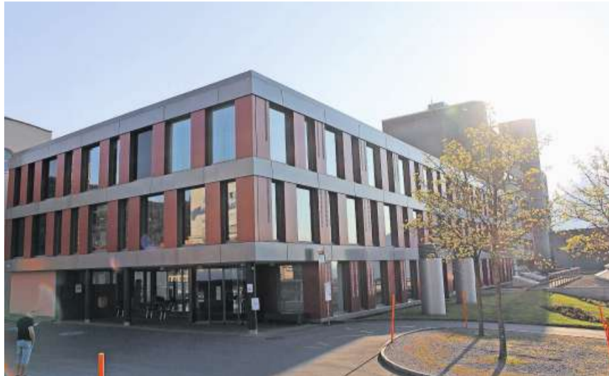
Das Spital Schwyz hat letztes Jahr 571 ausserkantonale oder ausländische Patienten behandelt. Die restlichen 6204 Behandelten sind aus dem Kanton Schwyz.

Rund 48,263 Millionen Franken Eigenkapital stehen nur 51,247 Millionen Franken Fremdkapital gegenüber. Damit lagen die eigenen finanziellen Mittel, also Betriebsvermögen, Fonds und Jahresergebnis, mit den fremdfinanzierten Kapitalien per Ende 2019 beinahe gleich auf. Das Betriebs- oder Jahresergebnis konnte gegenüber 2018